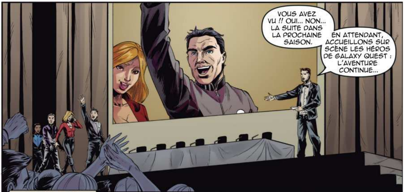
JASON NESMITH ALIAS LE COMMANDANT PETER QUINCY TAGGART !